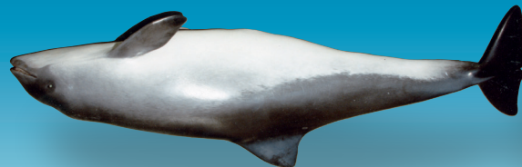
Bruinvis ( Phocoena phocoena )