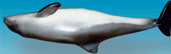
Bruinvis ( Phocoena phocoena )