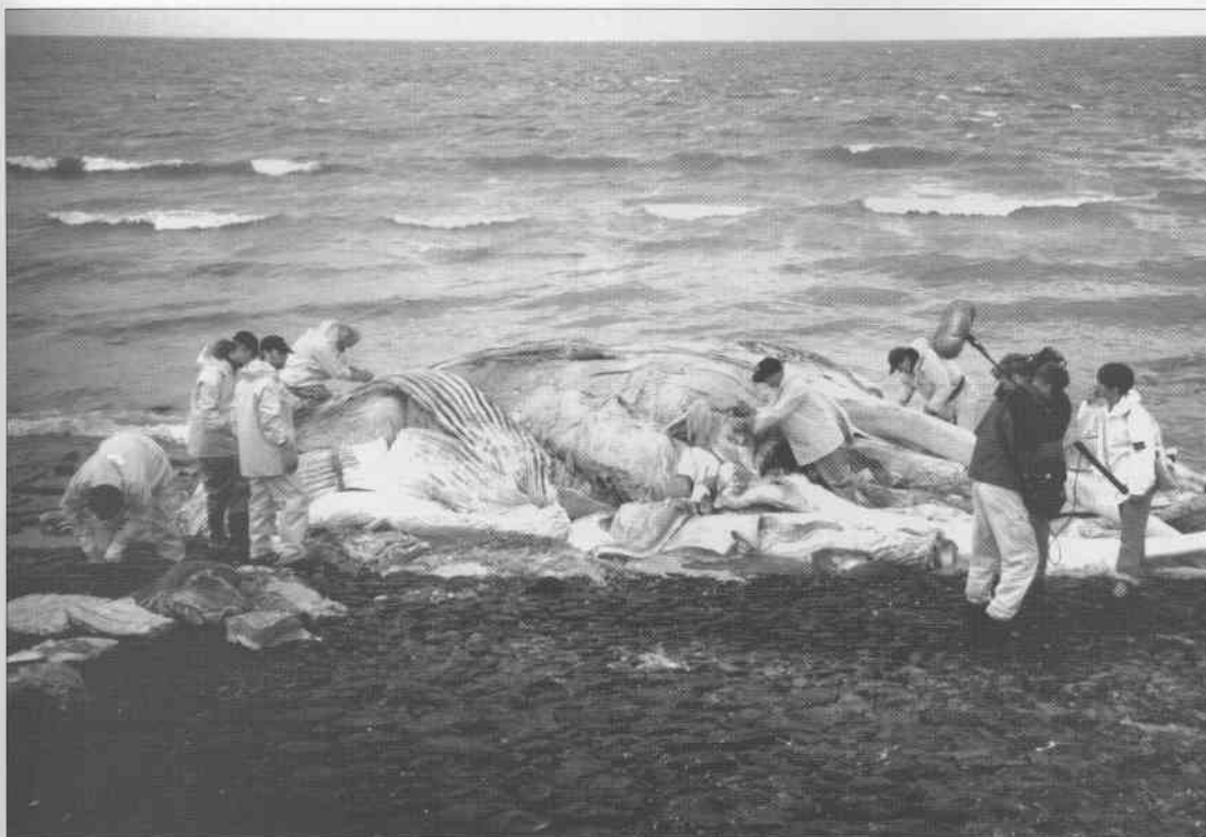
Figuur 1 Media belangstelling bij de ontleding van de gewone vinvis op de dijk bij Den Helder.

Op de dinsdag daaraan vooraf gaande was ik 's-middags in Naturalis om een manuscript met Chris Smeenk door te spreken toen de melding binnen kwam dat een grote dode walvis op zee voor de kust van Egmond aan Zee dreef. Volgens de bemanning van een reddingsboot was het in ontbinding verkerende kadaver ongeveer 15 meter lang. De reddingsboot was 12 meter lang en de walvis stak aan beide kanten een stuk uit. Direct begin je de hersenen te pijnigen over de vraag om welke soort het zou kunnen gaan. Een potvis in de zomer kon niet, deze viel gelijk af. Vijftien meter was te lang voor een dwergvinvis ( Balaenoptera acutorostrata ), die